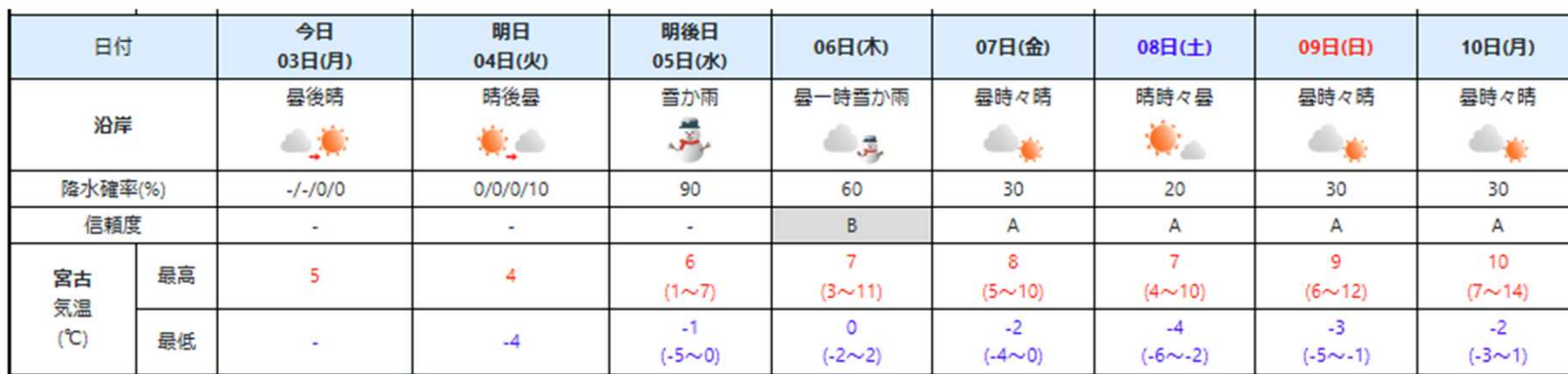
週間天気予報 (3月3日から10日まで) 3月3日11時発表

大船渡市付近の5日から6日の量予想 (3日14時現在) 3月5日から6日は、本州の南岸を低気圧が北東へ進む影響で風・波の注意報を發表する見込み。 雨量：5日から6日の総雨量は50ミリ 降雪量：5日未明から昼前まで 平野部： 5センチ 山沿い：10センチ 風：5日から6日は海上を中心に東よりの風が強まる 海上：15メートル 陸上： 8メートル 波：5日から6日は波が高くなる 波の高さ 3メートル