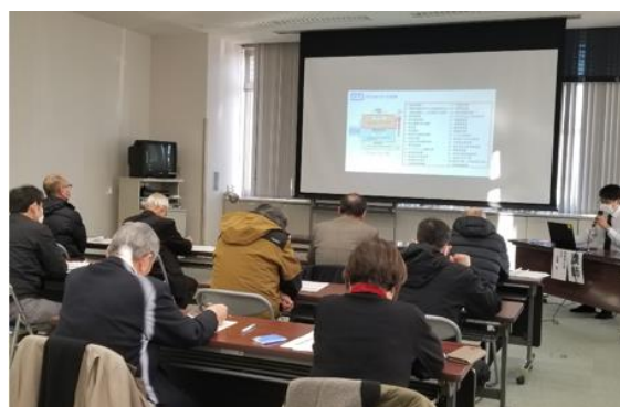
衛生管理計画作成講習会