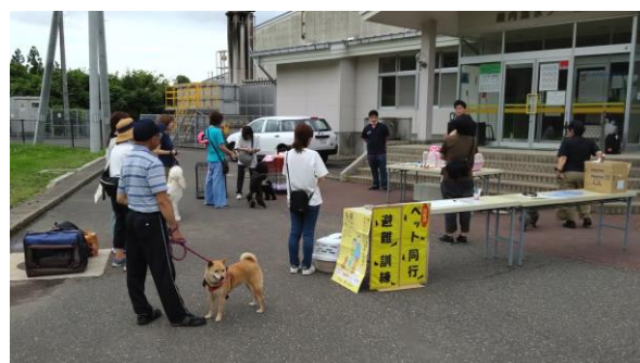
災害時のペット同行避難訓練