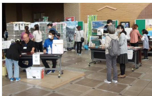
動物愛護フェスティバル