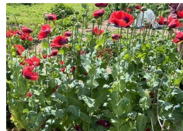
抜去した”けし”の花

薬物乱用防止のため、24名の薬物乱用防止指導員、薬剤師会及び保護司会の協力を得て地域に密着した啓発活動を実施するとともに、当所から講師を派遣し、薬物乱用防止教室を開催した。また、不正大麻、けしを抜去し、その撲滅に努めた。