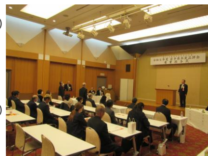
昨年度の褒章授与式