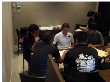
地域別ワークショップの様子（野田村）