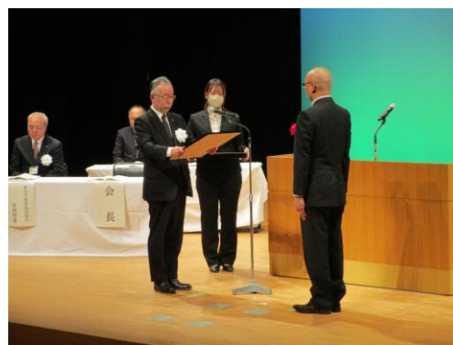
令和 6 年度久慈地方農業振興大会表彰式