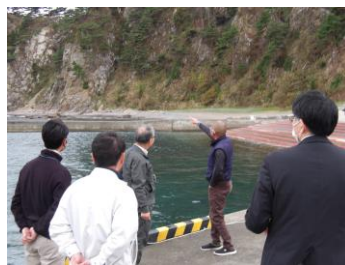
現地視察の様子（久慈市）

※1 県北地域の水産物をPRするため、久慈管内の漁業協同組合、県漁連、市町村及び県を構成員として、平成11年に設立された任意団体である。令和7年度から「海業」の推進を事業に含めている。