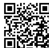
令和6年度表彰式 (YouTube 動画にリンク)

INPIT（インピット）では、ワークショップ参加後も発明の疑問にオンライン相談会でお答えします！お気軽にご相談ください！