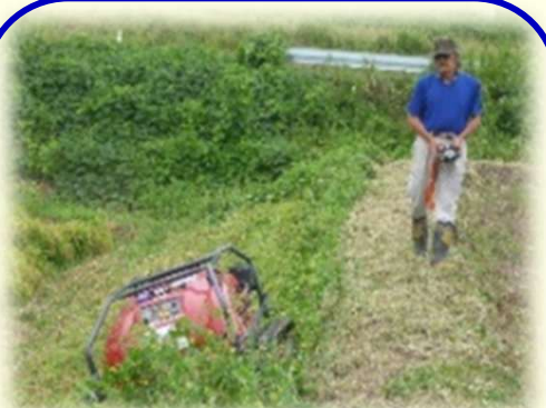
ラジコン草刈機の導入