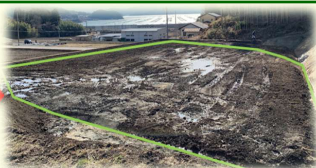
区画拡大 3枚のほ場を1枚に区画拡大。作業効率が大幅アップ