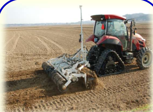
自動操舵システムの導入