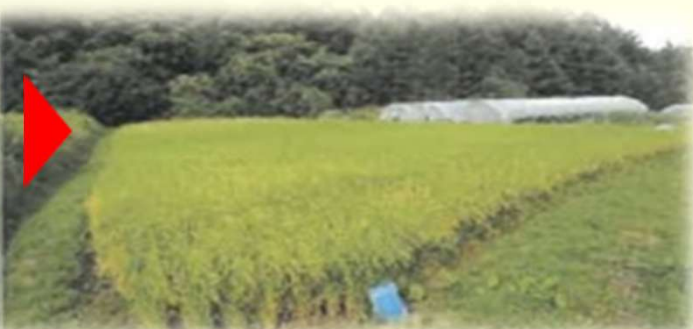
暗渠排水 湿田に暗渠排水を整備。機械化を導入し収量改善