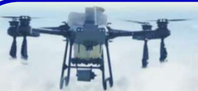
農業用ドローンの導入 (農薬・肥料散布)