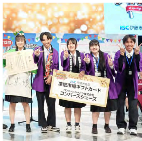
文部科学大臣賞（大賞）を受賞した沼津商業高校の皆さん