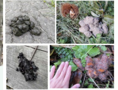
食べたもの：（上段左から）黒っぽい、クマ （下段左から）サクラの実、カキ 「美の国あきたネット ツキノワグマ情報」より