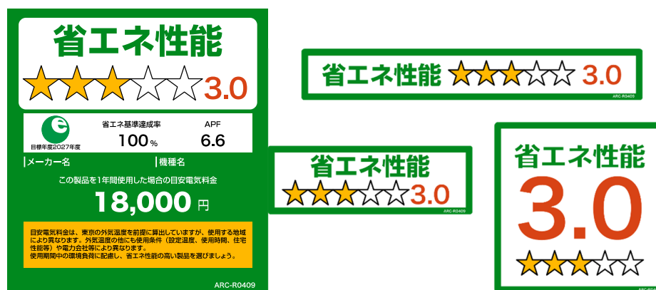
〔図3〕統一省エネラベル※