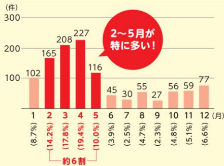
林野火災の月別出火件数(令和2年～6年の平均)