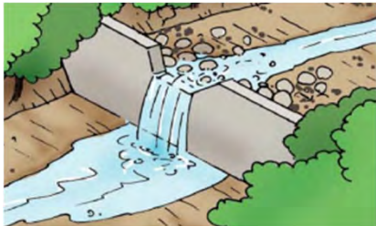
《図：林野庁HP パンフレット「ちさん」》

【治山ダム】 ダムの背後に土砂を堆積させることで、溪岸や溪床の浸食を防ぎ不安定土砂や倒木の流出を防ぎます。