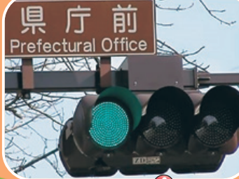
しんごう き 信号機