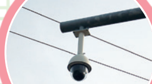
ひかり 光ビーコン