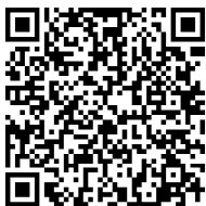
【岩手県警察採用サイト】