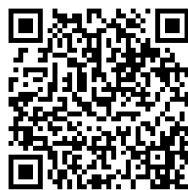
【岩手県職員募集案内HP】