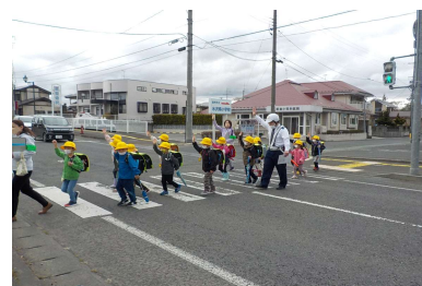
「横断歩道の日」における歩行者 の保護・誘導活動の状況